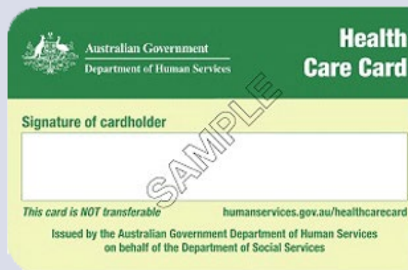
Health Care card