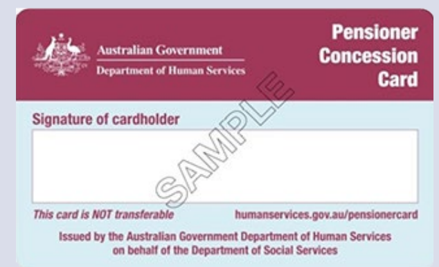
Pensioner Concession card