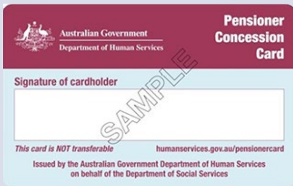
Pensioner Concession card کارت تخفیف بازنشستگی

هنگام مراجعه به خدمات پزشکی همیشه کارت Medicare خود را همراه داشته باشید.