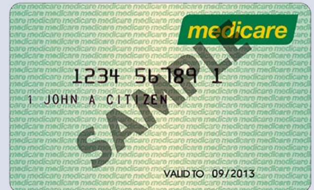
Medicare card کارت Medicare