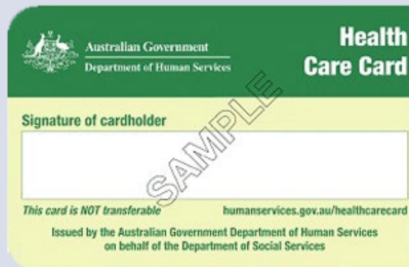
Health Care card کارت صحت و تداوی