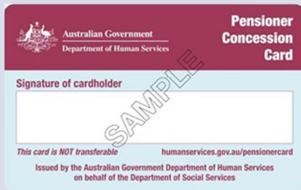
Pensioner Concession card کارت تخفیف تقاعدی

همیشه کارت Medicare خود را هنگام مراجعه به خدمات طبی همراه داشته باشید.