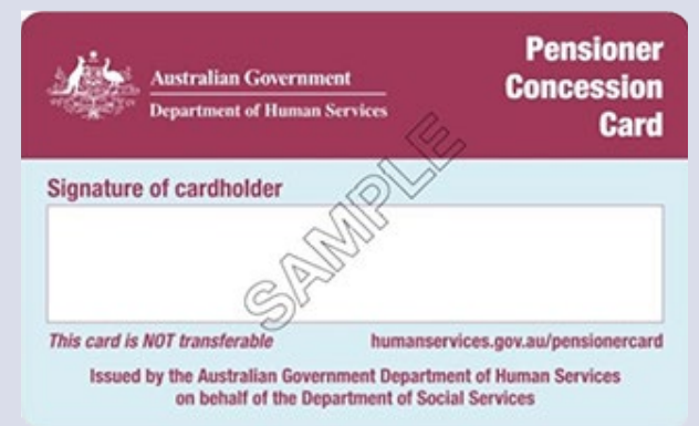
Pensioner Concession card အငြိမ်းစား လျှော့ဈေးသက်သာခွင့် ကတ်ပြား