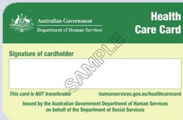
Health Care card ကျန်းမာရေး စောင့်ရှောက်မှု ကတ်ပြား