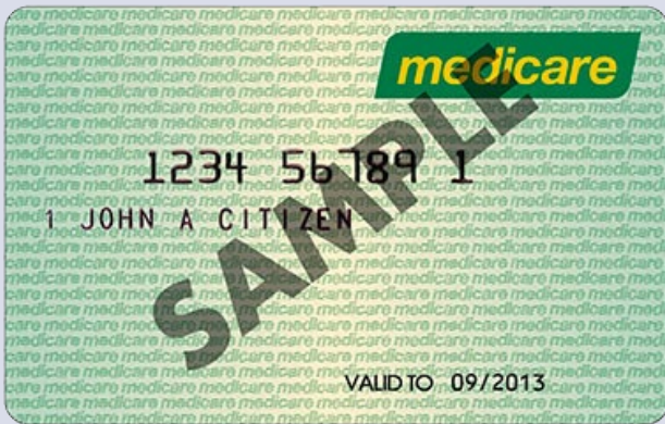
Medicare card Medicare ကတ်ပြား

စရိတ်သက်သာသော သို့မဟုတ် အခမဲ့ ဝန်ဆောင်မှုများ ရရန် လျှော့ဈေးသက်သာခွင့် ကတ်ပြားကို သင်နှင့်တစ်ပါးတည်း အမြဲ ယူဆောင်လာပြီး သင် ကျန်းမာရေး ဝန်ဆောင်မှုများ သုံးစွဲသည့်အခါ ပြပါ။