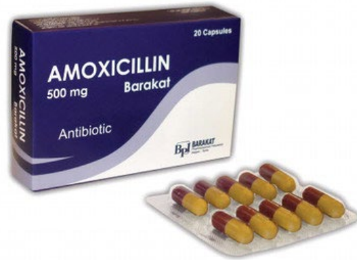
Contoh ubat antibiotik

Jika anda mendapati sesuatu yang tidak kena pada diri anda, pergilah berjumpa dengan doktor atau ahli farmasi. Mohon khidmat jurubahasa jika anda memerlukannya. Khidmat jurubahasa disediakan secara percuma.