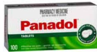
ကုန်ထုတ်တံဆိပ်

ဆေးစပ်ရောင်းသူမှ မေးမြန်းခြင်း မရှိခဲ့ပါက ၎င်းတို့အား သင်လိုအပ်သော ဆေးဝါး၏ မျိုးကွဲအာနိသင်တူသောဆေးဝါး (ဈေးနှုန်းပိုနည်းသောတံဆိပ်) ရှိပါသလားဟု မေးမြန်းနိုင်ပါ သည်။