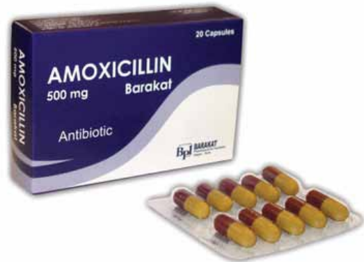
နမူနာပဋိဇီဝဆေးများ

သင်တစ်ခုခုဖြစ်နေသည်ကို သတိပြုမိပါက သင့်ဆရာဝန် သို့မဟုတ် ဆေးစပ်ရောင်းသူနှင့် တွေ့ဆုံဆွေးနွေးပါ။ လိုအပ်ပါ က စကားပြန်တစ်ဦး တောင်းဆိုနိုင်ပါသည်။ စကားပြန်များမှာ အခမဲ့ဝန်ဆောင်ပေးပါသည်။