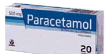
မျိုးကွဲအာနိသင်တူ ဆေးဝါး