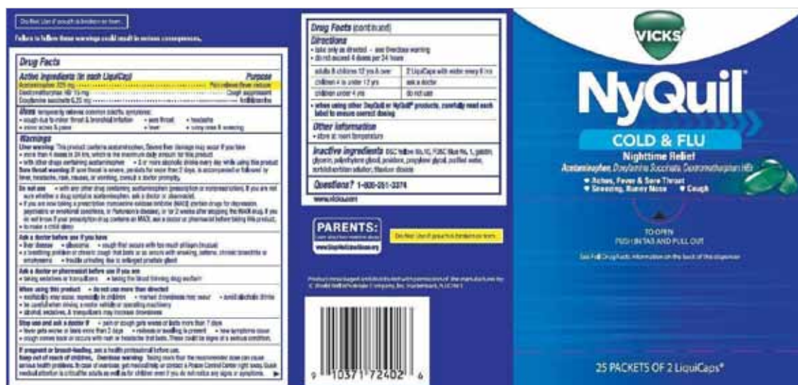
ညွှန်ကြားချက်များပါသည့် နမူနာဆေးဝါးတံဆိပ်